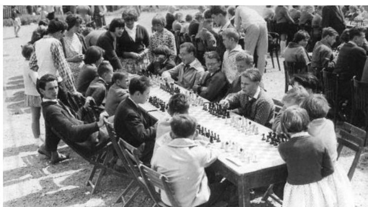
VČERA A DNES. První ročník 1963 na fotbalovém hřišti – zatím i bez hodin (nahore). Luxus Chrudimi (dole).

turnaj dvojic do 10 ti let je stále populárnější, letos proběhne již 26. ročník. Nejlepší hráče a hráčky přivezl loni Unichess Praha, druhé místo