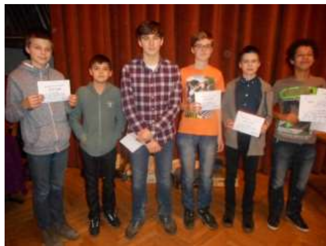
Gymnázium Matyáše Lercha