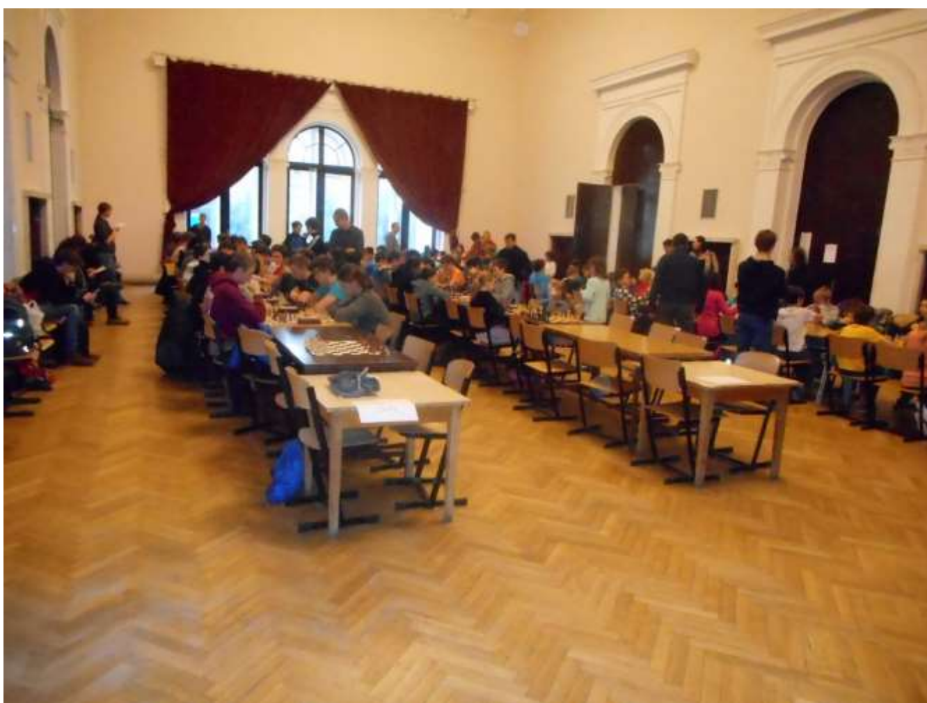
Celkový pohled do hrací místnosti v Lužánkách