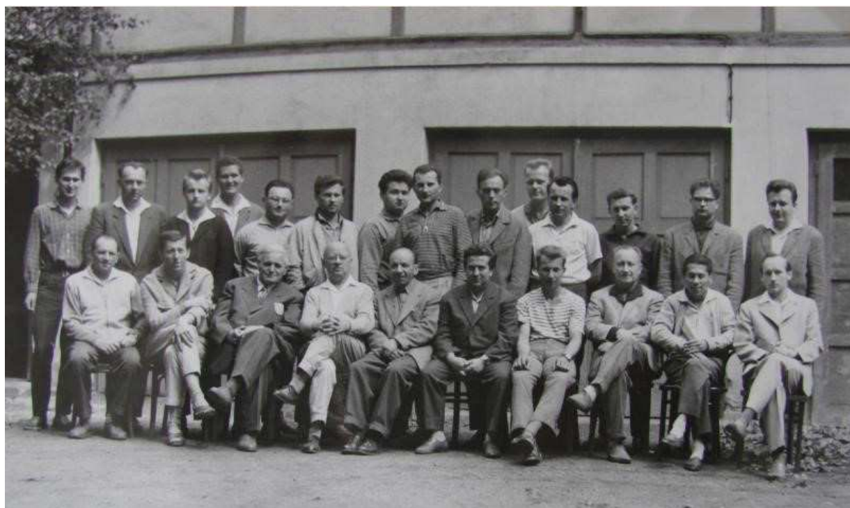
(KP Gottwaldov 1964 – Jahn stojící třetí zleva)